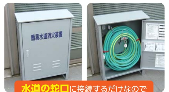
水道の蛇口に接続するだけなので誰でも簡単に使用できます。

大塚5・6丁目及び根津・千駄木の木造密集地域に簡易水道消火装置(街かど消火栓)が設置されます。設置にあたっては地域の住民に対して設置場所の確認や使用方法の説明を行い、さらに消防団等と連携して訓練を実施することで、有効に活用されるよう支援してまいります。