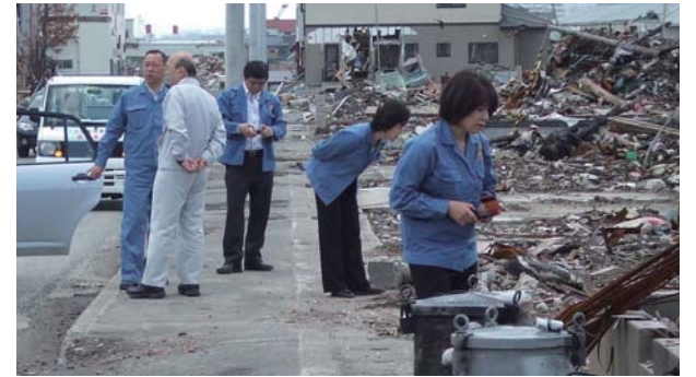
村上気仙沼市議より市内の津波被害を伺う